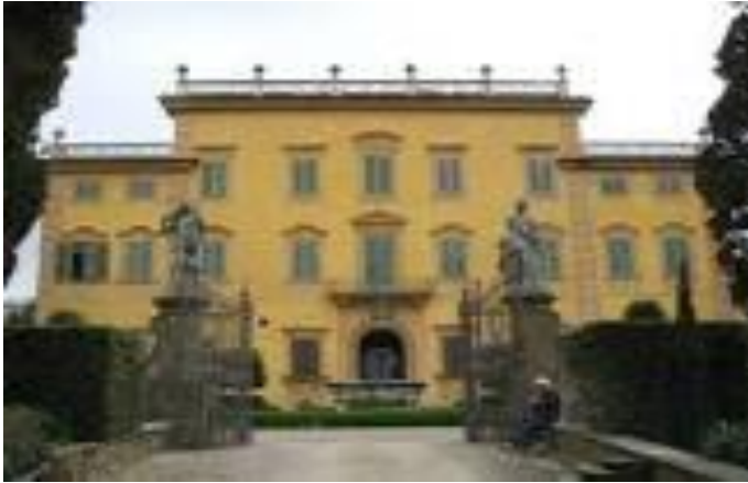
Villa La Pietra, sede della NYU Florence

La stessa NYU Florence oggi ha adottato dalla scuola Olivetti l'approccio multidisciplinare dell'affiancamento degli studi umanistici a quelli economici. "La scuola formò diverse generazioni di impiegati ed esperti olivettiani seguendo una filosofia aziendale innovativa, che sposava tecnologia e design e applicava i principi estetici alle pratiche industriali, un modello dato oggi per scontato grazie all'ubiquità dei prodotti