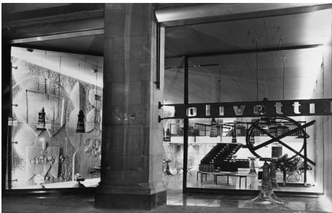
Negozi Olivetti sulla Fifth Avenue, NY

Il suo modello di politica culturale fu unico nella storia del '900. Non "mecenate, ma dotato della volontà e capacità di inserire organicamente la cultura nell'attività produttiva": così scrive Carlo Giulio Argan, che definisce Adriano "ideatore di una metodologia applicata alle strategie progettuali dell'azienda che assolda uomini di cultura affinché con i tecnici giungano alla soluzione esatta di problemi che in apparenza avevano ben poco a che fare con la sfera dell'arte e della cultura."